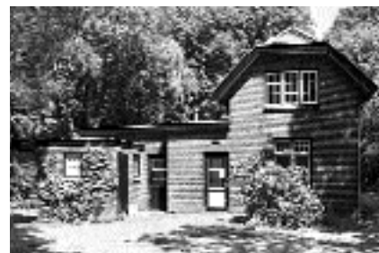
Louis Bolk Instituut